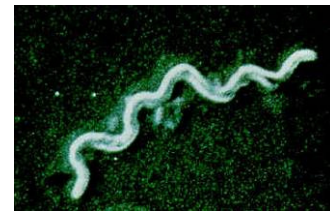
Borrelia burgdorferi – eine Spiralbakterie mit einem Spektrum von weltweit über 300 nachgewiesenen Arten

(nach Monaten bis Jahren): Zigaretten-papierartige Hautverdünnung am Handrücken („Acrodermatitis chronica atrophicans“), Borrelien-Lymphozytom (Ohr, Nase, Hodensack), Antriebsarmut, Sensibilitätsstörungen, Bewusstseinsstörungen, Muskelentzündungen, Gelenkentzündungen und -Schwellungen, Sehnen-Entzündungen, Schleimbeutel-Entzündungen, Blutgefäß-Entzündungen, Herzmuskelerkrankungen, Depression.